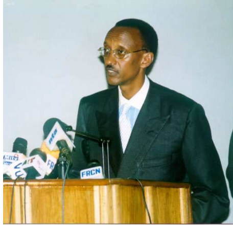
Madaxweynaha Ruwaanda, Paul Kagame

Kadib markii ay guusha heshay jabhaddii RPF ee uu hoggaaminayey Paul Kagame waxa la dhisay dawlad loo dhan yahay. Dawladdani waxay mamnuucday in la isu kala saaro isir oo reer Ruwaanda dad qudha oo walaalo ah yihiin.