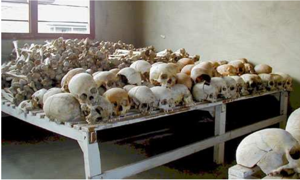
Lafihii dadkii lagu xasuuqay Ruwaanda oo lagu ururiyey Matxaf

Way sii muuqatay, cid walibana way sii arkaysay in xasuuqani dhacayo, cidse dheg u dhigtay dhawaaqii soo yeedhayey iyo digniintii ma jirin. Waddamadii waaweynaa ee Maraykan, Faransiis iyo Ingiriis ugu horreeyeen iyo Qarammadii Midoobay way ka dhego adaygeen wax ka qabashada masiibadan. Kaaga daranta markii xasuuqu bilaabmayna golihii ammaanku wuxu amar ku bixiyey in laga soo saaro ciidammadii tirada iyo tabartaba yaraa ee halkaas ka joogay, halkii ay ahayd in loo diro ciidammo xoojiya si xasuuqa loo baajiyo. Weydiimo badan oo halkaa ka dhashay, ujeedooyin siyaasadeed oon jirin baa hadheeyey. Jawaabta meesha ku qarsoonayd waxay ahayd in shacbiga Ruwaanda aanay u qalmin in la badbaadiyo.